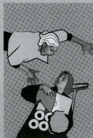
Akademikerin contra Putzfrau – who will win?